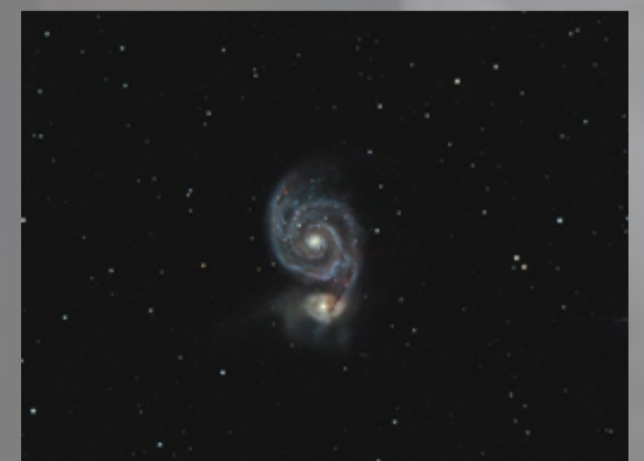
M51 Galaxia del remolino