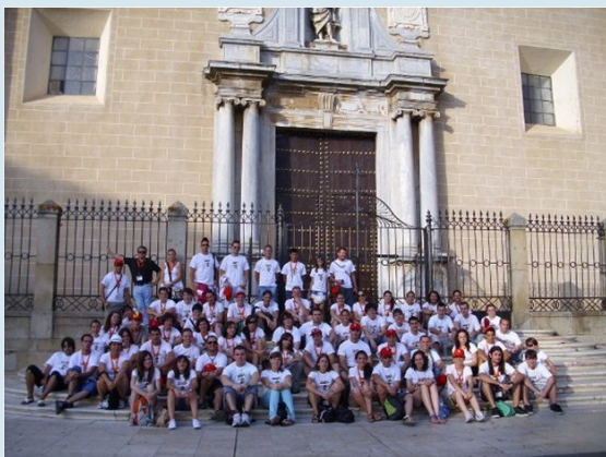
XI Encuentro Nacional (Badajoz 2010)

El primer encuentro se realizó en el año 2000 en la ciudad de Granada. Sucesivamente se han ido realizando encuentros anuales en distintos lugares de la geografía española.