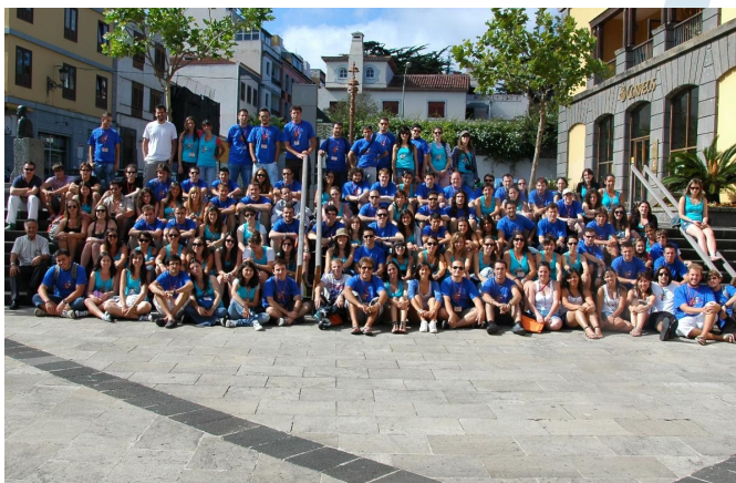
XII Encuentro Nacional (La Laguna 2011)

Ser socio de ANEM es abrir tu mundo matemático más allá de tu clase, más allá de tu facultad... es abrir tus matemáticas a una nueva dimensión.